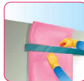
Corte el material excedente con una navaja o cuchillo con filo.