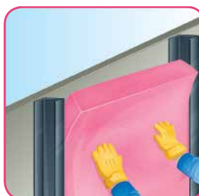
Presione hacia la cavidad.

En algunos pisos, como en los de duela o de madera, suele instalarse sobre el firme de concreto una estructura de madera con Aishogor de 7.6 cm (3") de espesor. Esto proporciona gran confort térmico y acústico en las habitaciones. Apropia para la capa doble.